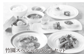
竹園スペシャルランチセット