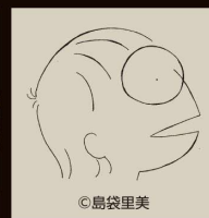
朗読 柴田元幸 Motoyuki Shibata