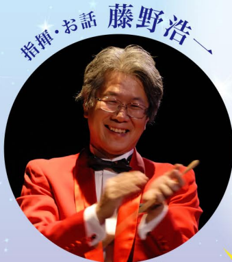
指揮・お話 藤野浩一